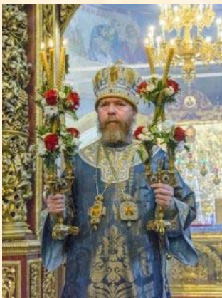
Митрополит Псковский и Порховский Тихон

Х рам святителя Василия Великого расположен на невысоком холме в самом сердце Пскова, недалеко от Кремля. Первое летописное упоминание о небольшой деревянной церкви относится к XIV столетию. Существующий каменный храм был построен в 1413 году и остается в Пскове единственным каменным