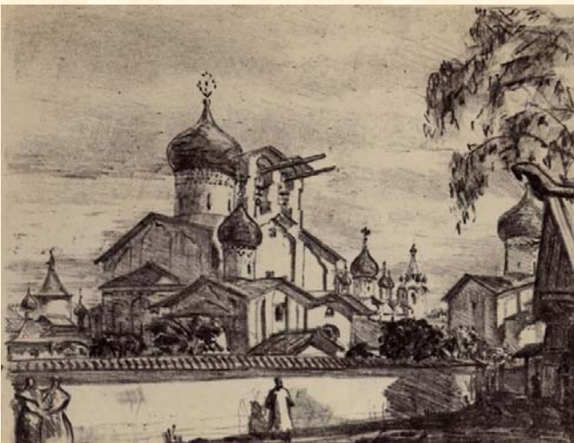
Храм Василия на Горке (40-50-е годы XVI века)